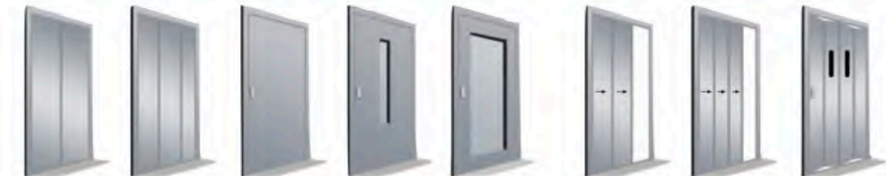
Automática 2 hojas, Automática 3 hojas, Semi-automática Ciega, Semi-automática Mirilla, Semi-automática Gran Mirilla, Automática 2 hojas, Automática 3 hojas, Tipo Bus