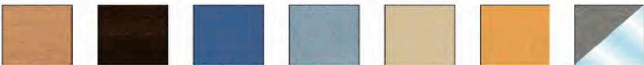
Madera Clara, Madera Oscura, Azul, Cielo, Crema, Melocotón, Opción Pared Acero Inox o Cristal