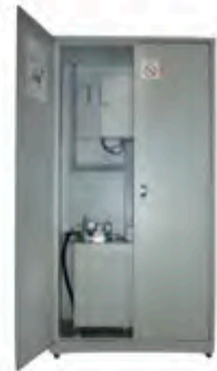
Armario centralita (Opcional)